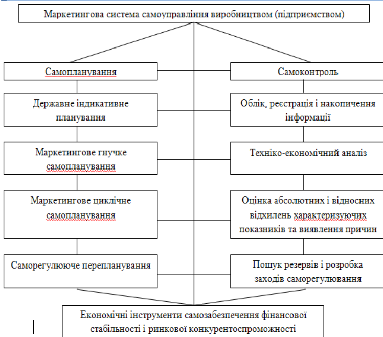
Рис. 2. Схема маркетингової системи самоуправління виробництвом (підприємством)

Виходячи із важливої потреби економічних досліджень, розробок і розрахунків, необхідно передбачати в штатних розкладах лінійних інженерно-технічних працівників і адміністративно-управлінського персоналу відповідну чисельність менеджерів-економістів, здатних якісно і своєчасно забезпечити економічну стабільність і конкурентоспроможність на ринку. Разом з тим, обумовлюється потреба повного перезавантаження системи управління виробництвом і повною виробничо-господарською діяльністю. Сучасну маркетингову систему самоуправління виробництвом можна запропонувати в наступному схематичному вигляді ( рис. 2).