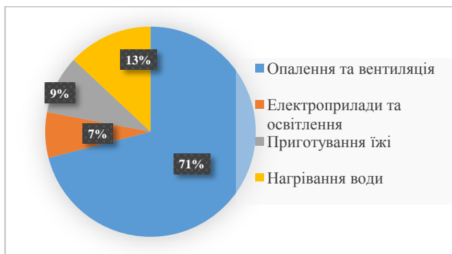
Рис. 2. Структура споживання енергії в житлових будинках[1]

Вклад основного матеріалу. Загальна площа житлового фонду України становить 1066,6 млн. м 2 - це 10,2 млн. будинків, із них 238,2 тис. будинків(загальною площею 67,5 млн. м 2 ) – у комунальній власності. 88% від загальної площі перебуває у приватній власності, а житловий фонд міст складає 63,9% загальної площі. У будинках, що перебувають в аварійному стані проживає 145,7 тис. мешканців їх загальна площа становить 5,1 млн.м 2 . Близько 30% наявного житлового фонду потребує капітального або поточного ремонту. 36 тис.будинків зараховано до категорії старих. Міський житловий фонд складається: - історичної забудови, історичне значення яких ускладнює їх модернізацію - будинки перших масових серій 50-60х рр. (цегляні, великопанельні та великоблочні) , які потребують капітального ремонту та енергомодернізації - 9-8 поверхових великопанельних будинків масової забудови 70-80-х рр., які потребують енергомодернізації та якісної експлуатації сучасних будинків [1, с.34]