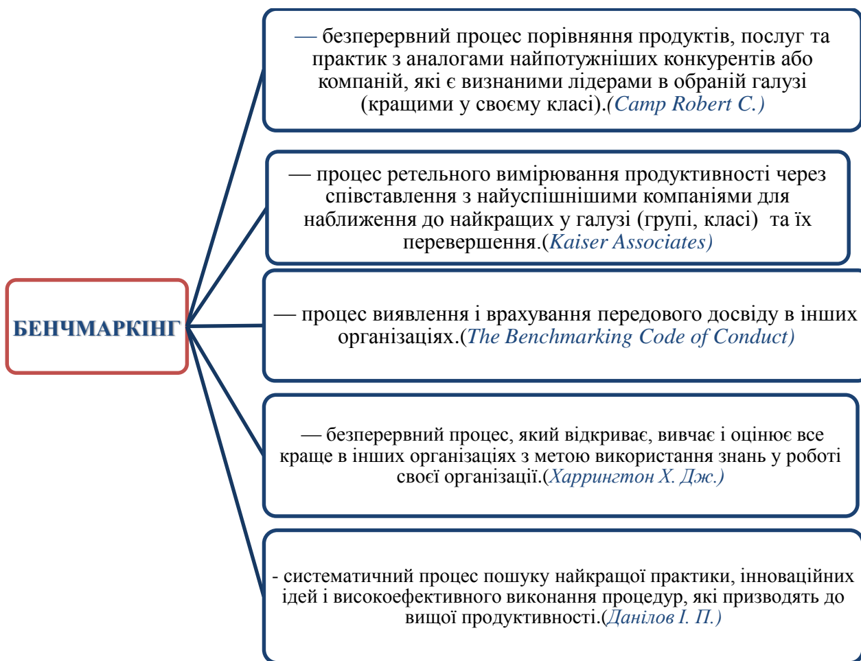
Рис.1. Основні визначення поняття бенчмаркінг.

На рисунку 1 наведено деякі формулювання даного терміну, проте цей перелік не є вичерпним.