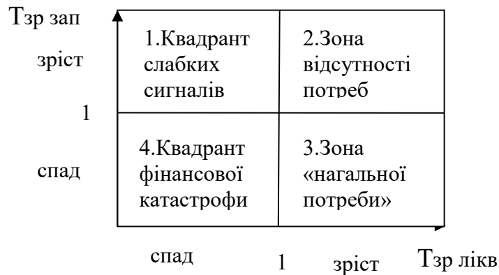
Рис.1. Графічна модель діагностики потреби будівельного підприємства у реструктуризації

Також я рекомендую розглядати не статичні значення фінансових коефіцієнтів у певний момент часу, а їх динаміку протягом певного ретроспективного горизонту. Звичайно, показником динаміки є ланцюговий темп зростання кожного з показників.