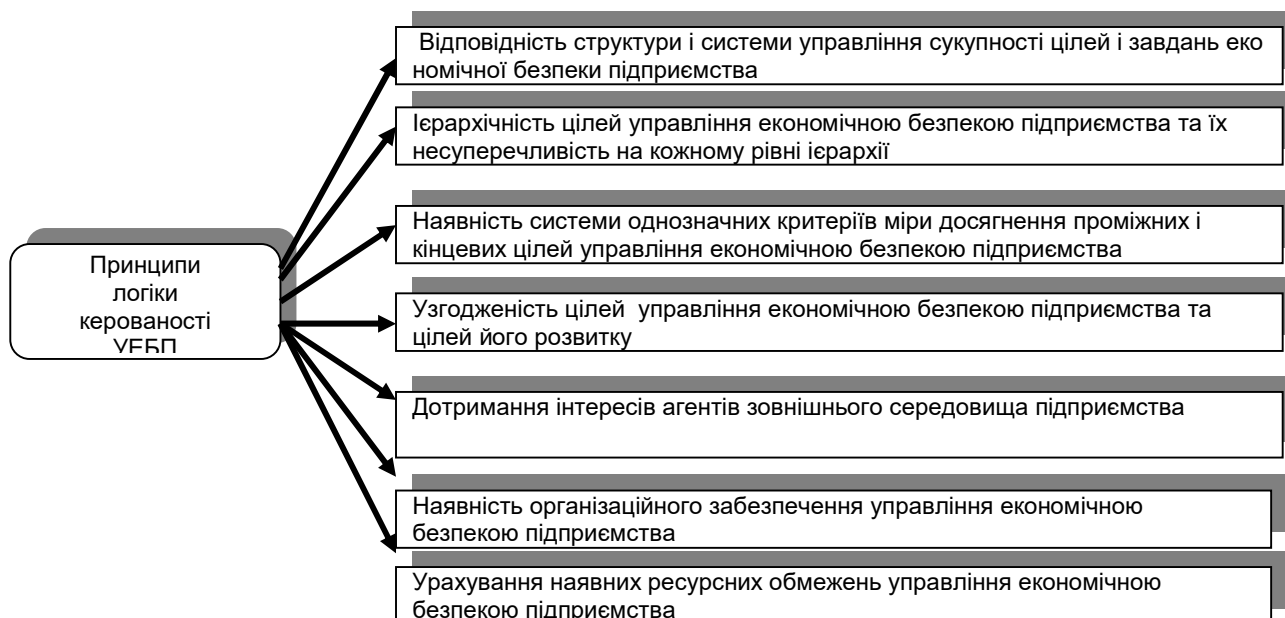
Рис. 2. Основні принципи логіки керованості економічної безпеки підприємства

їх несуперечливість на кожному рівні ієрархії має відповідати цілям узгодження інтересів внутрішнього середовища підприємства. Наявність системи однозначних критеріїв міри досягнення проміжних і кінцевих цілей управління економічною безпекою підприємства може варіювати відповідно до специфіки підприємств різної галузевої належності.