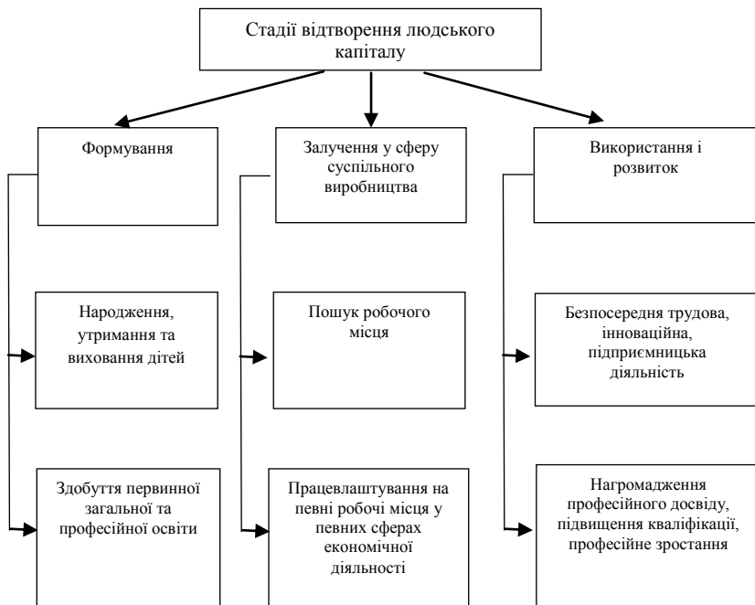
Рис. 1. Процес відтворення людського капіталу

Підвищення якості життя як важливого чинника розвитку людського капіталу вимагає удосконалення соціально-трудова відносин, покращення матеріальних, соціальних і культурних умов життя людей, забезпечення випереджаючого росту професійної та загальнокультурної підготовки працівників, здатних забезпечити ефективне використання нової техніки. І навпаки, уповільнення розвитку людини та її здібностей, тобто людського капіталу суттєво впливає на зниження темпів економічного розвитку. Тому створення сприятливих соціальних умов життя для широких верств населення і його трудової діяльності є необхідною умовою ефективного використання і розвитку людського капіталу.