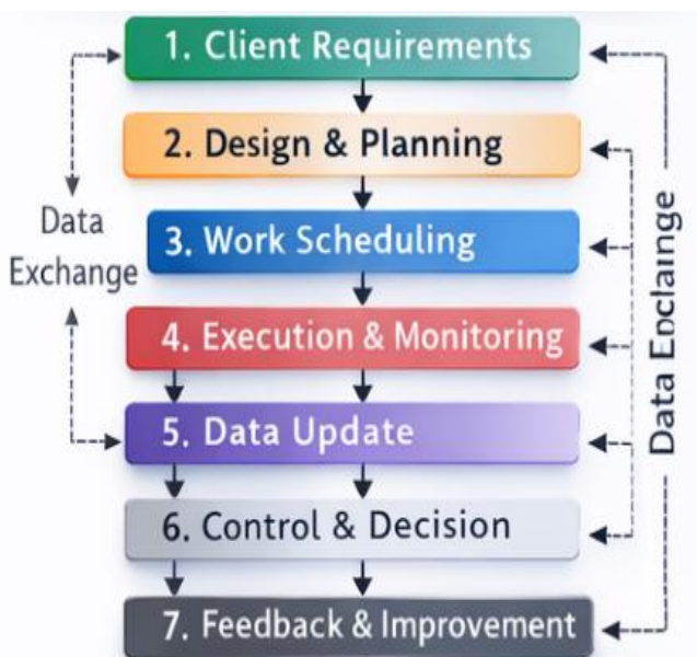
Рис. 1 Процес координації інформації

Замість послідовної передачі даних (клієнт — проєктувальник — підрядник) пропонується модель, де всі учасники оперують у спільному інформаційному середовищі. Це дозволяє враховувати виробничі обмеження заводу ще на стадії проєктування, забезпечуючи стовідсоткову монтажну готовність конструкцій.