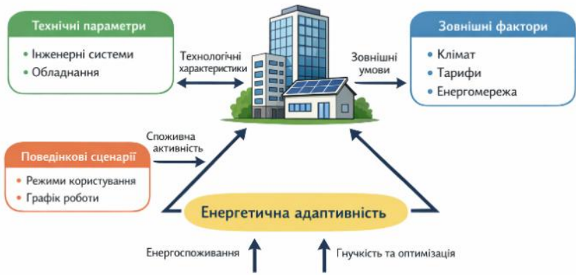
Рис. 1. Концептуальна модель енергетичної адаптивності будівлі (розроблено автором на основі [2])

У межах цієї моделі енергоспоживання розглядається як функція від множини змінних, що змінюються у часі. Узагальнене навантаження будівлі може бути описане наступною залежністю: