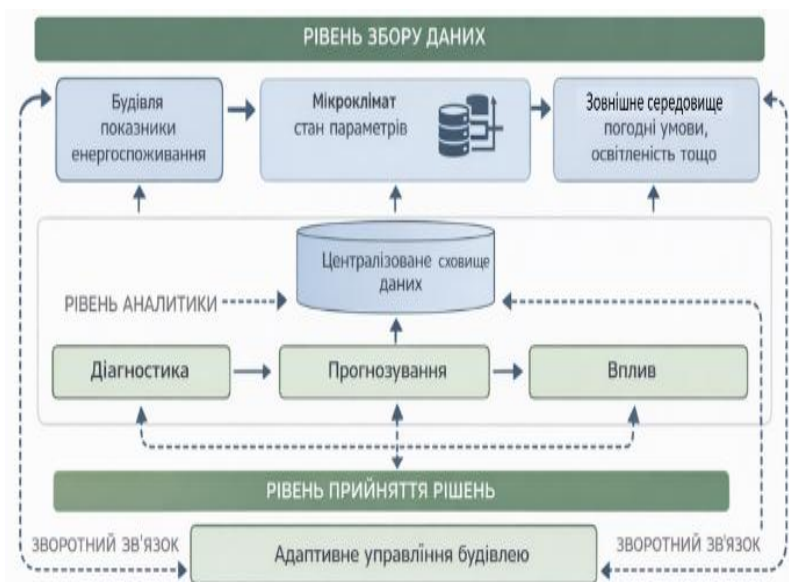
Рис. 2. Архітектура системи моніторингу та оцінювання енергетичної адаптивності будівель (розроблено автором на основі [5])

Зазначена структура забезпечує реалізацію замкненого циклу управління, у якому результати аналізу безпосередньо впливають на параметри функціонування будівлі. Важливою особливістю є наявність зворотного зв'язку, що дозволяє коригувати прийняті рішення відповідно до фактичних результатів їх реалізації.